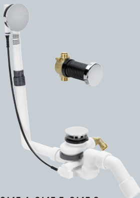
Modelle 6145.4, 6145.5, 6145.6

Multiplex Trio F-Ab-/Überlauf für den Wasserzulauf durch den Ablaufkörper