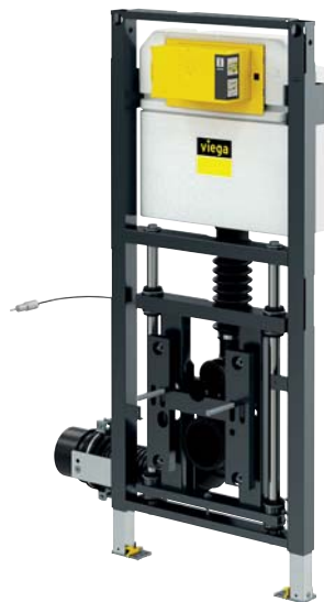
Prevista Dry-WC-Element Modell 8521.32, Artikel 772 024