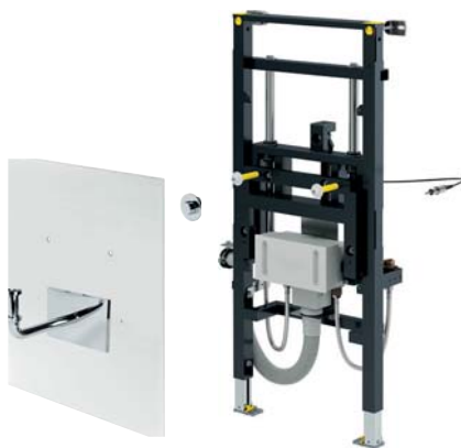
Prevista Dry-Waschtisch-Element individuell höhenverstellbar, Modell 8535.32, Artikel 776 213; Abdeckplatte: Modell 8570.45, EAN 785536

Das individuell höhenverstellbare Prevista Dry-Waschtisch-Element lässt sich per Knopfdruck auf die gewünschte Nutzerhöhe senken oder heben. Und das – wie schon bei dem erfolgreichen, individuell höhenverstellbaren WC-Element von Viega – rein mechanisch und ganz ohne Elektronik. Zusammen mit der integrierten Unterputz-Anschlussbox gewinnt das Bad so nicht nur an Komfort, sondern auch an Platz.