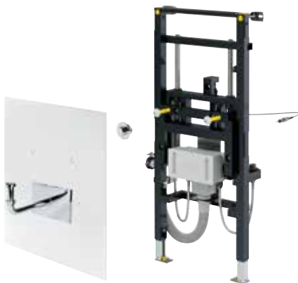
Waschtisch-Abdeckplatte Modell 8570.45, Artikel 785 536

Das individuell höhenverstellbare Prevista Dry-Waschtisch-Element lässt sich per Knopfdruck auf die gewünschte Nutzerhöhe senken oder heben. Und das – wie schon bei dem erfolgreichen, individuell höhenverstellbaren WC-Element von Viega – rein mechanisch und ganz ohne Elektronik. Zusammen mit der integrierten Unterputz-Anschlussbox gewinnt das Bad so nicht nur an Komfort, sondern auch an Platz.