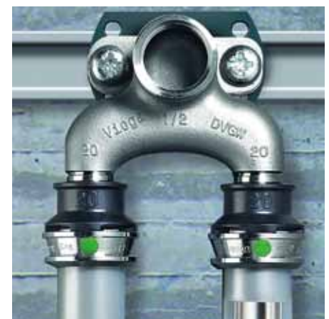
Als System geprüft: das „Raxinox“-System aus Edelstahlverbundrohr und Formteilen aus Edelstahl mit axialen Pressverbindungen.

Eine repräsentative Marktumfrage bei Installateuren und Fachplanern durch den VDMA unterstreicht die nach wie vor hohe Bedeutung, die dem DVGW-Zeichen als Qualitätslabel zugemessen wird.