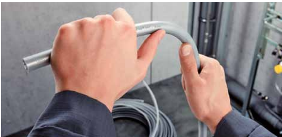
Kombiniert zertifiziert: das innovative „Raxinox“-Edelstahlverbundrohr von der Rolle.

Dabei handelt es sich um ein Metallverbundrohr-System, bestehend aus einem dünnwandigen aber dennoch drucktragenden Edelstahlrohr, umgeben mit einem Außenmantel aus PE-RT. Es ist derzeit in den Abmessungen 16 x 2,2 und 20 x 2,8 mm, mit oder ohne Schutzrohr oder vorgedämmt nach EnEV und DIN 1988-200, erhältlich. Dieses erste praxistaugliche „Edelstahl-Installationsrohr von der Rolle“ wird sekundenschnell – vorwiegend als Stockwerksverteilung in Vorwand-/Trockenbauinstallationen – mit einem Sortiment aus Form- und Verbindungsteilen (aus Edelstahl mit Stützkörpern aus PPSU 2) ) axial verpresst. Neben strömungsoptimierten Bögen und T-Stücken erlauben Doppelwandscheiben auch die Installation von Ring- und Reihenleitungen, die